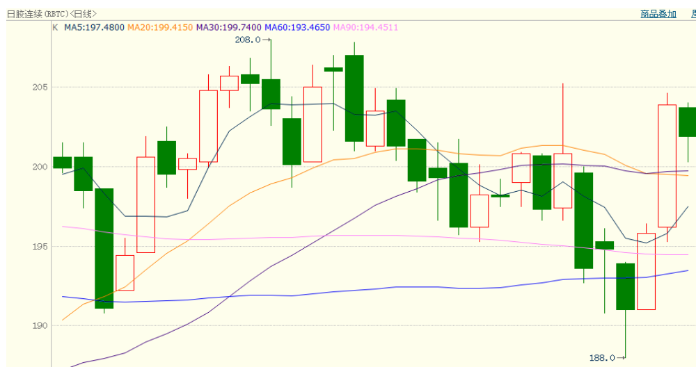
图 2、日胶连续 12 月 16 日行情走势