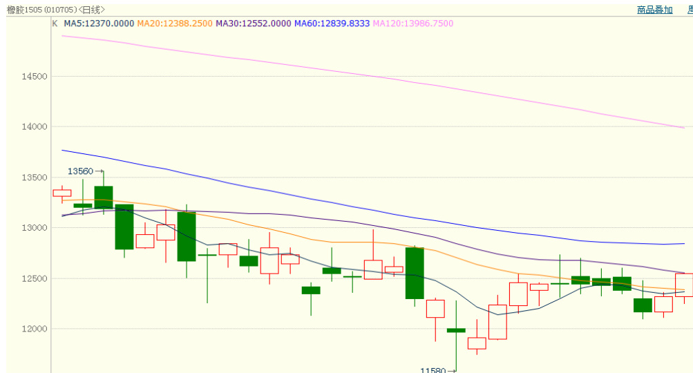
图 1、沪胶 1505 12 月 25 日行情走势