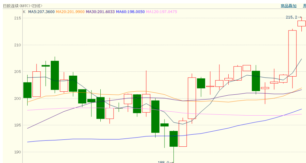
图 2、日胶连续 1 月 5 日行情走势