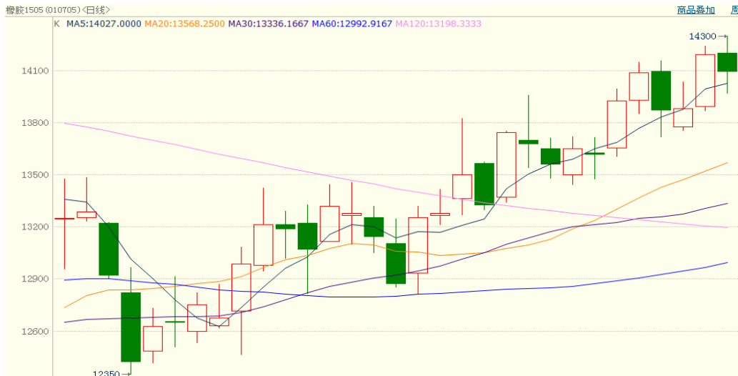
图 1、沪胶 1505 2 月 27 日行情走势