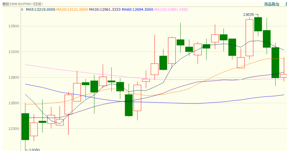
图 1、沪胶 1509 3 月 4 日行情走势