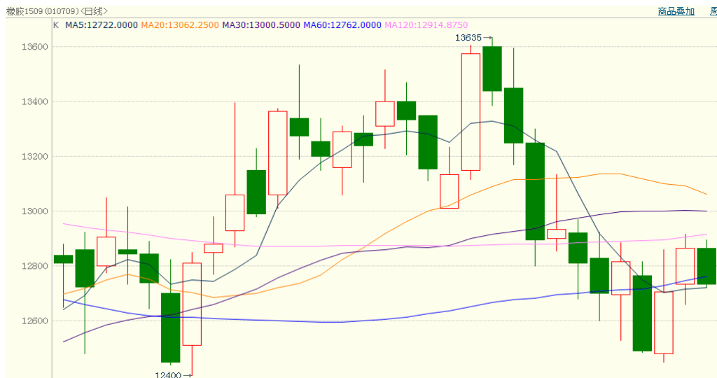
图 1、沪胶 1509 3 月 13 日行情走势