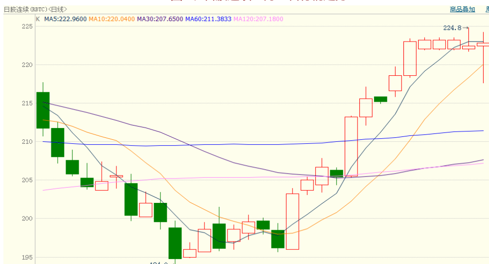
图 2、日胶连续 5 月 8 日行情走势