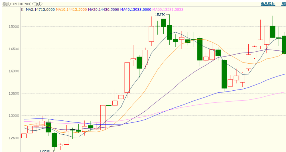
图 1、沪胶 1509 6 月 3 日行情走势